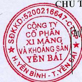
PHẠM QUANG PHÚ